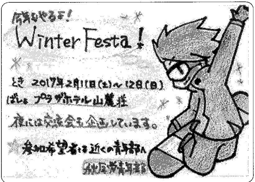
このティッシュのデザインも青年部役員作品