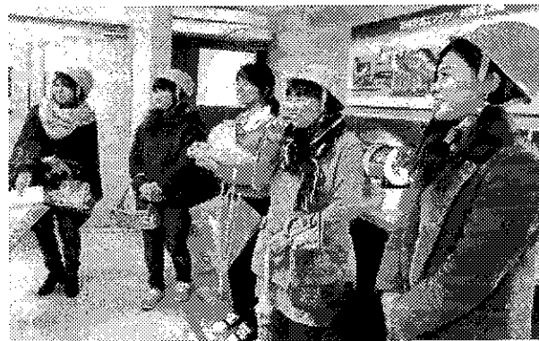
昨年は能代ロケット実験場を見学