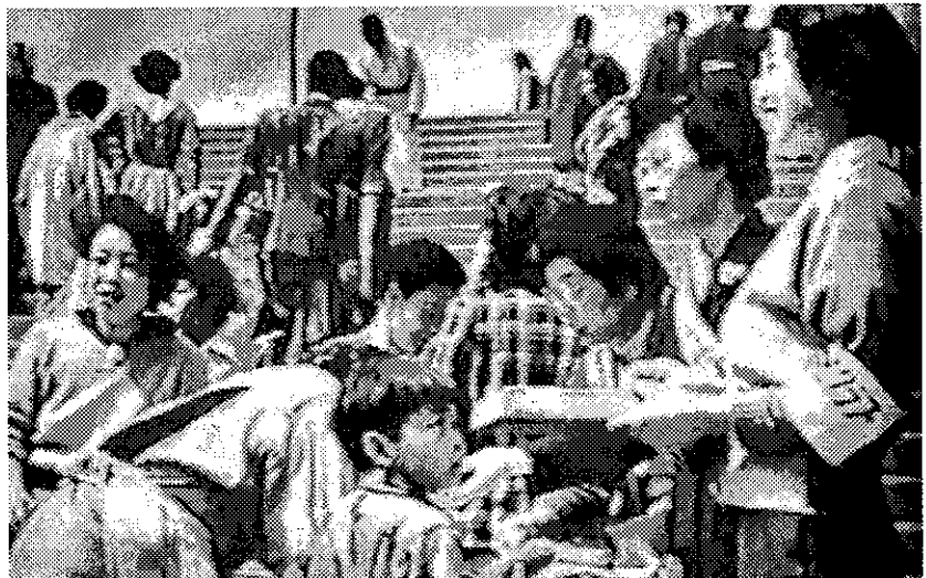
1954年全国の女性が原水爆禁止の署名運動を開始

原水爆禁止世界大会は、核の被害者、核兵器反対の運動をリードしてきた国の政府代表などが参加し、テーマ別の分科会(被爆者訪問など)で論議し交流ができるのが魅力です。また、被爆地だからこそ学べ