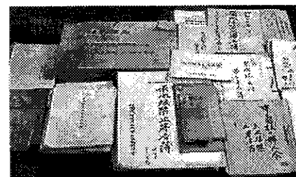
1954年に集まった原水爆禁止の署名