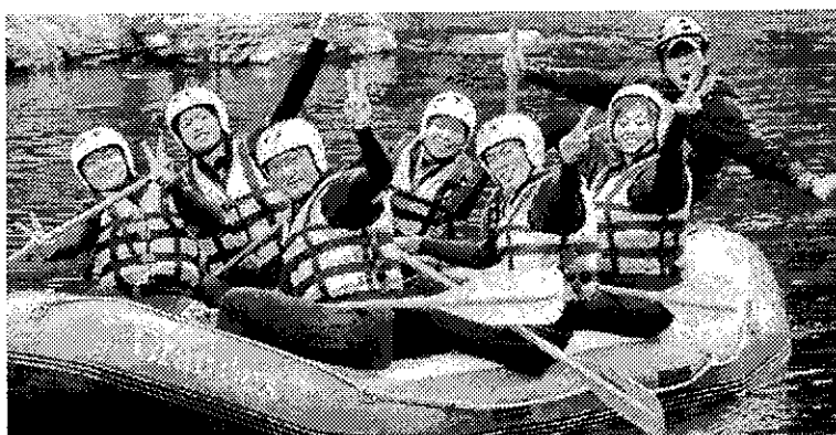
K's station in埼玉

田からたくさん青年を送り出そうと、6月23日に実行委員会を開催。「K's station」を全て