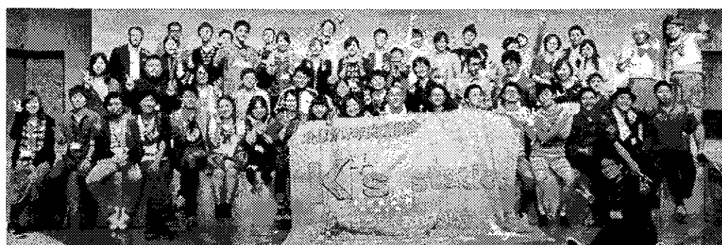
K's station in埼玉

来る10月6日(土)～8日(月)、あきた芸術村「わらび座」にて、全厚労青年集会「K's station in秋田」が開催されます。全国から、医療・福祉施設などで働く同年代の仲間が集まる貴重な機会です。