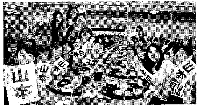
新入組合員学習と交流のつどいの様子（夕食交流会）

6月2日（日）、今年度入職した新入組合員を対象に、「新入組合員学習と交流のつどい」を開催します。秋田県農村医学会と日程重複を避けるため、6月の開催に決定。会場は仙北市にある「あきた芸術村・温泉ゆぽぽ」です。「つどい」では、グループワークや夕食交流会などを企画しています。入職して3ヶ月が過ぎ、仕事にも慣れてきた頃。仕事やプライベートのことを同年代と語りリフレッシュしましょう。同じ支部での交流はもちろん、他支部・他職種の仲間と交流を深める機会です。職場でも新しい仲間を「つどい」に送り出して下さい。