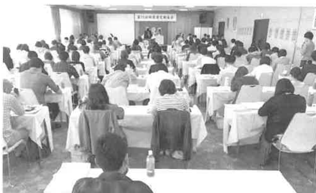
2019年の第72回定期大会の様子

たくさんの方が意見をだし議論に加わることで、より良い方針がつくられます。事前に各支部へ議案書を送付します。当日の大会に参加できない組合員も、総括・方針案などを読んで、意見を代議員に託してください。