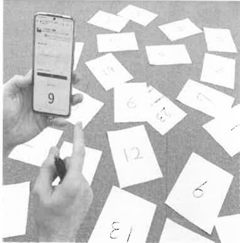
↓抽選アプリで1〜3等を選びました

「抽選方法を変えてほしい」という意見も寄せられました。部会では、「まずは抽選方法を知ってもら