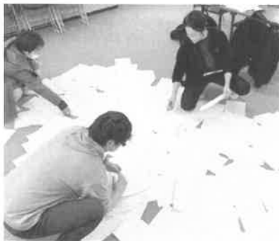
↑200人の中から4等175人を選び...

秋厚労教育宣伝部は、現場目線を大事に「読まれる・参加できる・繋がりが持てる」をモットーに秋厚労新聞を発行しています。2月10日(金)第2回教育宣伝部会にて、秋厚労新聞の新春クイズの抽選を行いました。