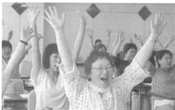
2014年の女性集会の様子

6月24日（土）午後1時から、秋田市御所野の「秋田テルサ」にて、女性集会を開催します。一緒に、学び、交流し、リフレッシュしましょう。