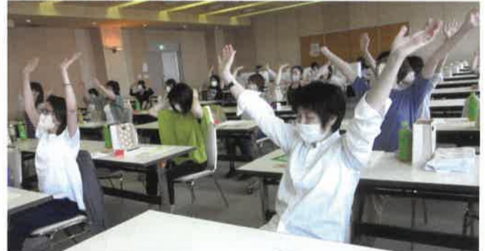
☆笑いは体にも健康にもよい。帰ったら子どもとジャンケンの笑うのをやってみたいと思います