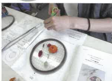
☆夢中で作って楽しかったです