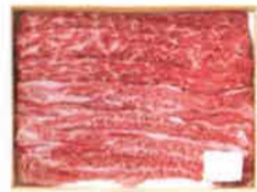
ももすき焼き用松坂牛