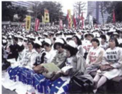
1992年 日比谷野外音楽堂

1989年に全国で看護師の労働条件改善、社会的地位向上を目指す運動が「ナースウェーブ行動」のはじまり。5月12日が「看護の日」と設定されてからは、多くの団体がアピールする期間になっています。この運動を経て、看護師・介護士を増やすための枠組みである「看護師確保法」「福祉人材確保法」が制定されました。今日の医療・福祉現場を支えてきた運動です。