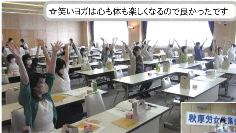
☆笑いヨガは心も体も楽しくなるので良かったです

2023年6月24日(土)、午後から秋田テルサにて4年ぶりの秋厚労女性集会在開催されました。感染対策のため当日現地での人数を制限し、21名が参加しました。前半は「笑いヨガ教室」、後半は「手芸講座」を行いました。組合のてびきのミニ解説(女性に関する労働条件)も好評で、多くの方が交流しました。