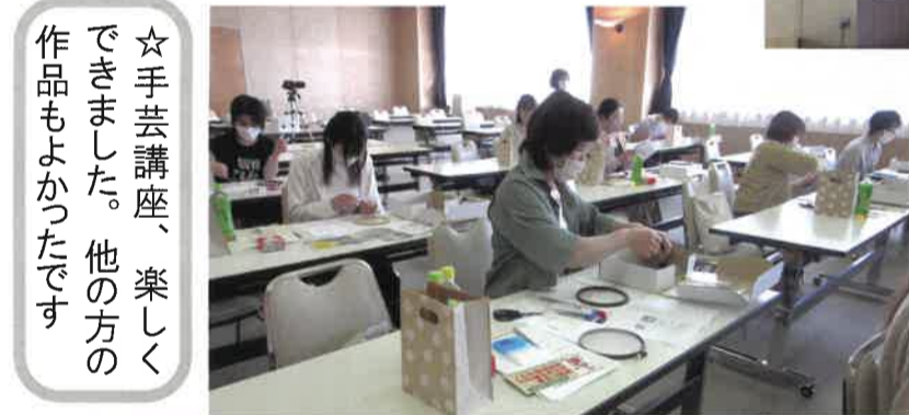
☆手芸講座、楽しくできました。他の方の作品もよかったです