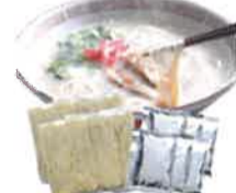
博多長浜屋台ラーメン