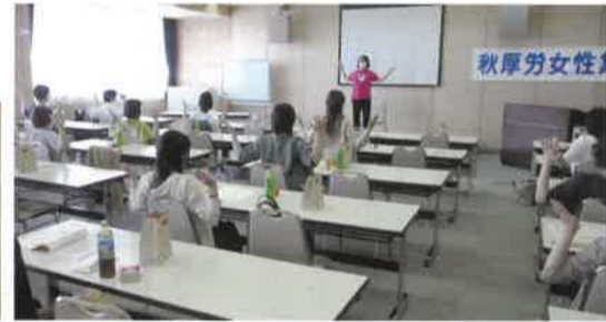
☆楽しかった。リフレッシュできました

2023年6月24日(土)、午後から秋田テルサにて4年ぶりの秋厚労女性集会在開催されました。感染対策のため当日現地での人数を制限し、21名が参加しました。前半は「笑いヨガ教室」、後半は「手芸講座」を行いました。組合のてびきのミニ解説(女性に関する労働条件)も好評で、多くの方が交流しました。